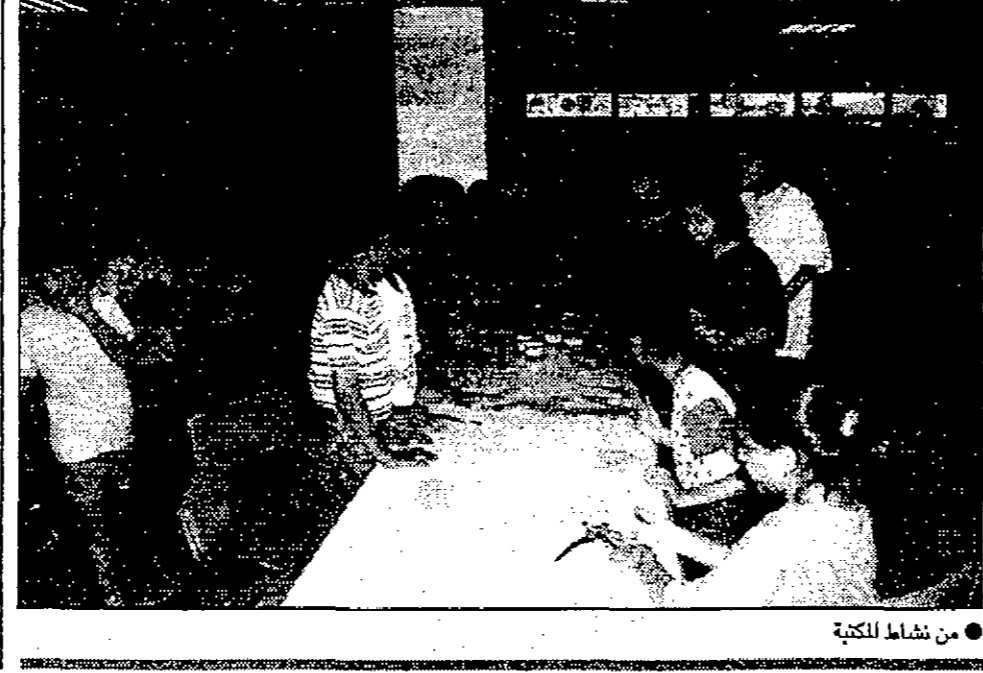
● من نشاط المكتبة